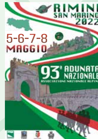
Il manifesto ufficiale dell'Adunata

Le cartoline dell'Adunata 2022 sono 8 , raccolte in un cofanetto realizzato in 5 mila pezzi e in vendita al costo di 7 euro . Riproducono altrettante immagini significative: oltre al